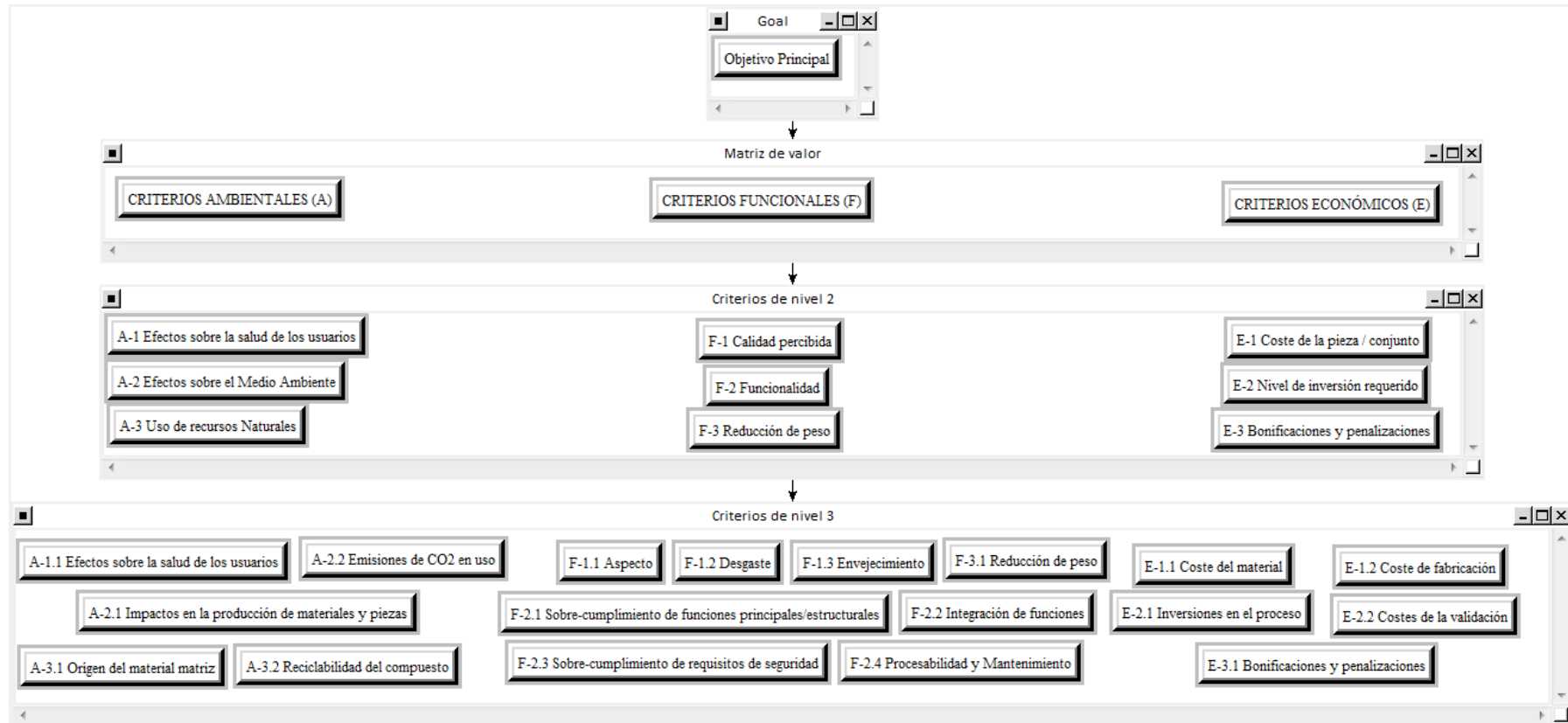
Figura 2: Estructuración de criterios del Análisis de Valor Multi-criterio.

Nota: Esta es la estructura jerárquica tal como se ha introducido en el software Superdecisions®, en forma de nodos y “clusters”, para su posterior ejercicio de ponderación.