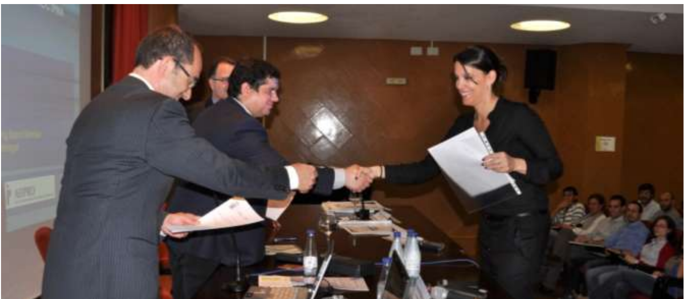
Entrega de diplomas a los certificados en Dirección de Proyectos

Afamado consultor, director de proyectos con más de 30 años de experiencia, conferenciante y autor de numerosos libros en el ámbito de la Dirección de Proyectos, ha participado en proyectos emblemáticos como el National Tennis Center (Londres) o el Cable and Wireless College (Conventry).