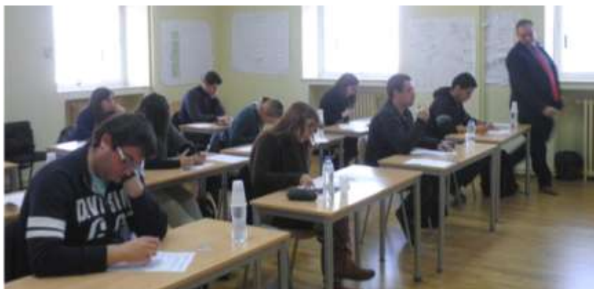
Participantes en la convocatoria de febrero en Madrid

Durante el primer trimestre de 2011, han tenido lugar cuatro convocatorias en Madrid, Costa Rica, Guatemala y Cádiz, con un resultado de 55 nuevos certificados. Hasta finalizar el año están previstas convocatorias en Madrid, Bilbao, Huesca, Valencia y Valladolid. Las fechas para estas convocatorias se publican en la página web de AEIPRO junto con las fechas límite para entrega de la documentación requerida.