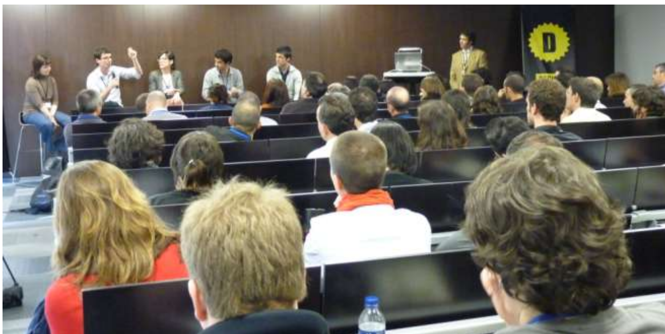
Sesión de Conferencias “People Driven Innovation”

Departamento de Mecánica y Producción Industrial Escuela Politécnica Superior de Mondragón (MGEP) MONDRAGON UNIBERTSITATEA