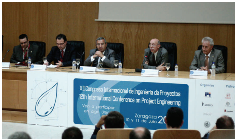
Sesión Inaugural del Congreso

Oficial de Ingenieros Industriales de Aragón y Rioja y el Departamento de Industria, Comercio y Turismo del Gobierno de Aragón, en las que diferentes empresas (SEAT, IDOM, REGABER, AVANZIT, SEIASA, SELCO, TAIM-TFG, ADES y FORCIMSA) presentaron el estado del arte y las perspectivas de futuro en temas tan atractivos como las energías renovables, la tecnología del hidrógeno, la moderniza-