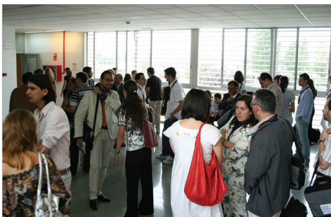
Congresistas discutiendo en torno a los Proyectos