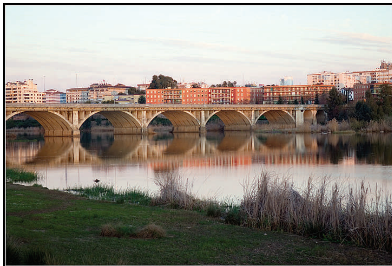
Puente de la Universidad- Badajoz

Teléfono : +34 695 96 19 08 Fax: +34 924 28 96 01 E-mail: secretaria@congresodeingenieria2009.com URL: http://www.congresodeingenieria2009.com