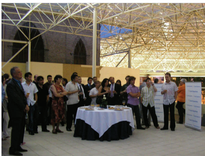
Clausura en el Teatro Romano de Cesar Augusta

Desde el Comité Organizador queremos expresar nuestra gratitud a todas las personas, empresas e instituciones que de una manera u otra han contribuido a que este Congreso se realizara de forma exitosa.