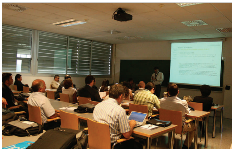
Presentación de uno de nuestros congresistas