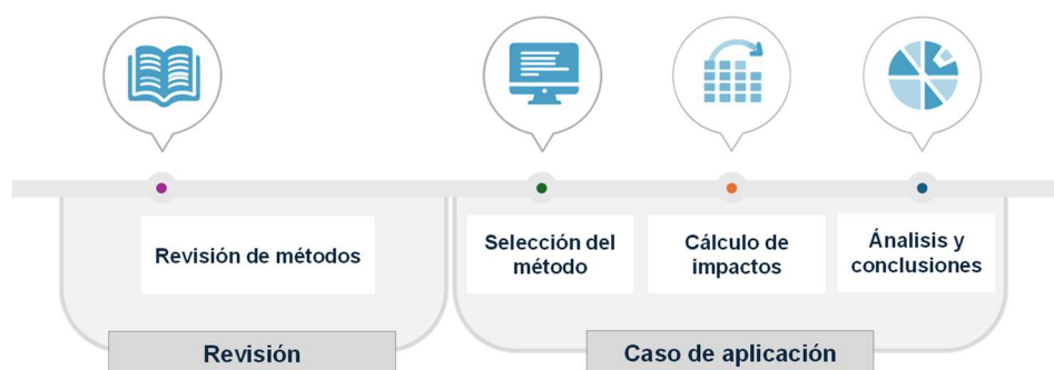
Figura 1: Metodología.

Para poder alcanzar dicho objetivo, es necesario establecer una metodología que permita por un lado recopilar la información necesaria en relación a los métodos de cálculos externos, destacando de forma específica la identificación de impactos sobre la salud, y por otro, su aplicación al caso de estudio, para lo que es necesario establecer una serie de fases, tal y como se observa en la Figura 1.