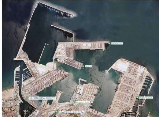
Figura 3: Ubicación de equipos de registro.

Estos logros resaltan el enfoque proactivo del Puerto de Valencia hacia la gestión ambiental y su búsqueda continua de oportunidades de mejora en las prácticas de sostenibilidad, especialmente en áreas donde tiene influencia directa sobre las emisiones. Recientemente, bajo el marco de la descarbonización se ha planificado una instalación de energía fotovoltaica aprovechando infraestructura radiada de 3.6 MW p para contribuir a alcanzar la reducción del 55% de sus emisiones establecida por la UE para 2030.