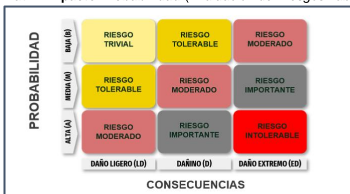
Figura 2. Matriz Impacto Probabilidad (Evaluación de Riesgos Laborales, no date).

En esta matriz se observan dos ejes: en el eje horizontal el impacto o las consecuencias que puede tener un accidente, y en el vertical, la probabilidad de que ocurra ese mismo. Cada eje tiene tres niveles, en el caso del impacto, puede ser de daño ligero (LD), dañino (D) o daño extremo (ED). En el eje vertical, la probabilidad puede ser baja (B), media (M) o alta (A). De este modo, se generan 9 posibles escenarios para cada causa asociada a un riesgo específico. Una vez entendida la metodología, se han evaluado todas las posibles causas. La evaluación de estos se puede observar en el apartado de resultados.