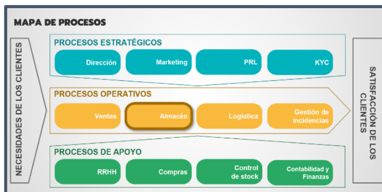
Figura 1. Mapa de procesos de la empresa XYZ (elaboración propia)

A continuación, se detalla como es el proceso, con el objetivo de observar más fácilmente los posibles riesgos que pueden tener los empleados en su puesto de trabajo.