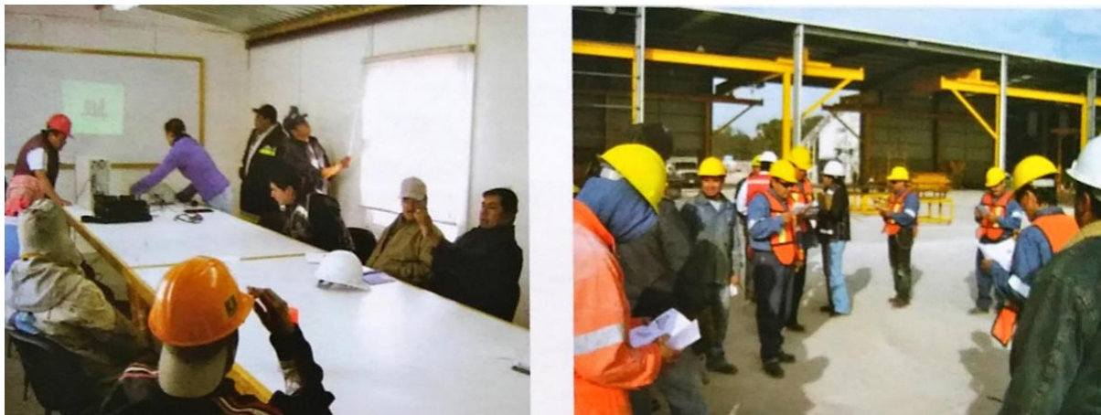
Fig. 1: (Izquierda) capacitación en aula, fig. 2: (derecha) capacitación de 5 minutos.