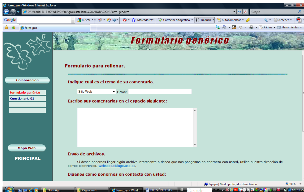
Figura 4. Vista de la página de colaboración

explotaciones agrarias en un estudio encargado por la Xunta de Galicia, para conocer su actitud y aptitud ante el cambio.