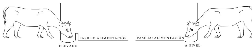
Figura 1: Disposición Vertical de Comedero

Continuando con el trabajo, pasamos a considerar la disposición vertical de los comederos: (comedero a nivel o elevado).