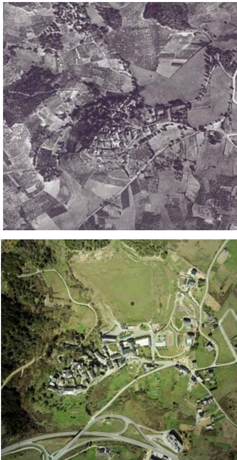
Figura 2: (1956 – 2005) Núcleo rural de O Castro. Comarca de Valdeorras (Ourense).

reducido a las cuatro capitales de provincia y a Santiago de Compostela, comienza a cambiar en esta década. De una distribución homogénea, anisótropa, de la población y el poblamiento hasta los años 60 se pasa progresivamente a un modelo territorial en que se intensifica la relación dialéctica oeste- este, Galicia Atlántica - Galicia Interior, Galicia urbana – Galicia rural. Estos cambios que afectan decisivamente al modelo de poblamiento y por tanto a la construcción del territorio, y en especial por su fragilidad, al territorio rural, se inician en la década de los años sesenta apoyados en las políticas de desarrollo estatales, profundizan en sus transformaciones en los setenta con el cambio de régimen y de organización del Estado y asumen el nuevo marco referencial autonómico, y el impuesto por la entrada en las instituciones europeas en los 80, para implantar y materializar físicamente ambos, en las dos últimas décadas del siglo XX.