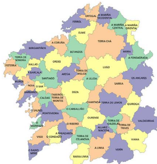
Figura 5: El Mapa Comarcal de Galicia.

Finalmente cabe señalar que el proceso de Comarcalización de Galicia va a entrar en un proceso de rápido declive desde el año 2003 (que culmina en el 2005 con el cambio de gobierno tras las elecciones autonómicas), que se reflejará en el cambio de posición dentro del organigrama de la administración autonómica gallega, pasando a depender toda la estructura, ya como Dirección General, no de Presidencia de la Xunta donde había nacido, sino de la Consellería de Política Agroalimentaria y Desenvolvemento Rural, con una clara vocación no ya transversal sino de acción sectorial, lo que desvirtúa en su momento las características intrínsecas del proyecto, concluyéndose la sustitución de los actores que habían alumbrado e impulsado el proceso.