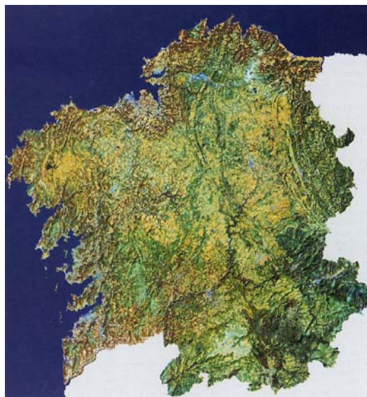
Figura 1: Galicia. Imagen de satélite.

Existe un amplio consenso en la consideración de que la estructura territorial de Galicia cambió a partir de la década de los años 60 del pasado siglo. El país atlántico de estructuras antiguas, rural y denso, el “universo agrario cerrado” que describe Bouhier 2 , de los hechos urbanos muy débiles, en estrecha relación de dependencia con su alfoz rural y con el mar,