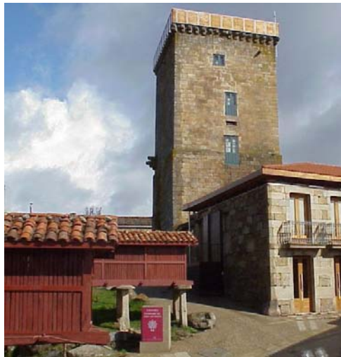
Figura 4: Los Centros Comarcales materialización arquitectónica de la Comarca. Centro Comarcal de Terra de Celanova (Ourense).

La Sociedad para el Desarrollo Comarcal de Galicia está configurada como una sociedad anónima de carácter instrumental y de servicios de apoyo al desarrollo territorial. Su objeto es la realización de actividades de investigación y prestación de servicios relacionados con los estudios, la planificación territorial y el desarrollo comarcal. Se le encomienda la realización de estudios, programas proyectos, planes y acciones de desarrollo local y comarcal y se recoge específicamente el carácter multisectorial de su actividad. Entre los servicios específicos recogidos en la ley como de prestación por parte de la Sociedad Comarcal está la coordinación de la red de gerentes de desarrollo comarcal y el diseño y gestión del Sistema de Información Territorial de Galicia. El hecho de la aparición con carácter específico de la referencia a estos dos instrumentos en la ley, (como con posterioridad, en un proceso de importancia creciente ocurrirá con los Centros comarcales de Galicia), establece su importancia específica dentro del proceso de comarcalización.