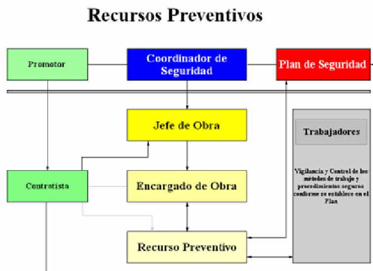
Figura 2.- Recursos