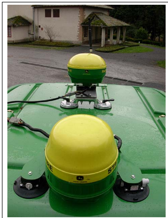
Figura 1. Colocación de las antenas GPS sobre la cabina.

Para determinar la trayectoria seguida por el tractor de forma fiable se han registrado los datos de posición usando el mismo sistema que para el guiado paralelo, pero con capacidad para capturar la señal SF2, proporcionada por Deere & Company. Este sistema precisa de una base fija, que se ha ubicado en una ubicación centrada respecto a las parcelas a analizar. La antena para el sistema de guiado paralelo se ha colocado en los anclajes que el tractor posee a estos efectos, en la parte superior de la cabina y centrada en la misma. La antena del GPS RTK se situó alineada con la anterior y separada 0,7 m. para reducir posibles interferencias de la señal. En la figura 1 se visualiza la colocación de ambas antenas sobre la cabina.