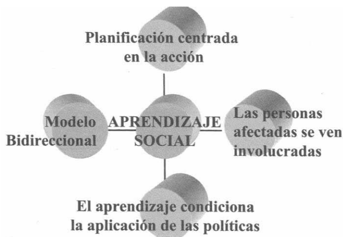
Figura 3: Características del aprendizaje social

LEADER está basado en el Aprendizaje Social, un modelo de planificación rural que tiene cuatro características importantes ( Ver Figura 3 ):