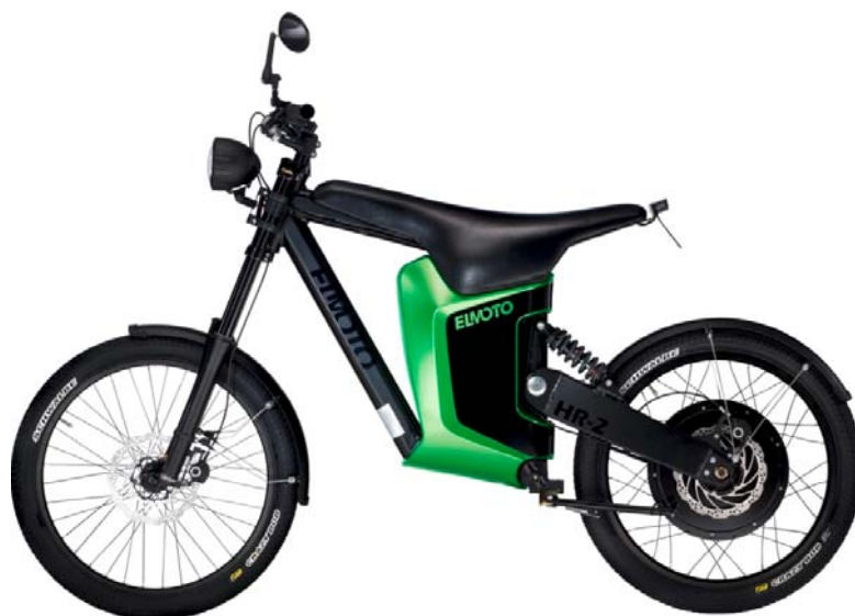
Figura 2. E-bike origen del proyecto ELMOTO HR-2