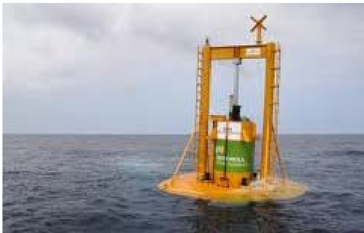
Figura 4: Dispositivo oscilante, tipo absorbedor puntual. (Santoña, Cantabria)

El principio de funcionamiento de los dispositivos convertidores de energía potencial consiste en recoger el agua de las olas incidentes para mover una o varias turbinas hidráulicas de salto reducido, y aprovechar así la energía potencial de las olas para convertirla posteriormente en energía eléctrica. Un ejemplo de este tipo de dispositivo es el Wavedragon (Figura 5) que se caracteriza por tener un reflector que dirige las olas incidentes hacia una rampa hasta un depósito situado a un nivel superior al del mar.