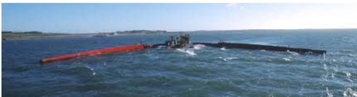
Figura 5: Dispositivo Wavedragon.

El principio de funcionamiento de los dispositivos convertidores de energía potencial consiste en recoger el agua de las olas incidentes para mover una o varias turbinas hidráulicas de salto reducido, y aprovechar así la energía potencial de las olas para convertirla posteriormente en energía eléctrica. Un ejemplo de este tipo de dispositivo es el Wavedragon (Figura 5) que se caracteriza por tener un reflector que dirige las olas incidentes hacia una rampa hasta un depósito situado a un nivel superior al del mar.